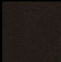
Testa di Moro